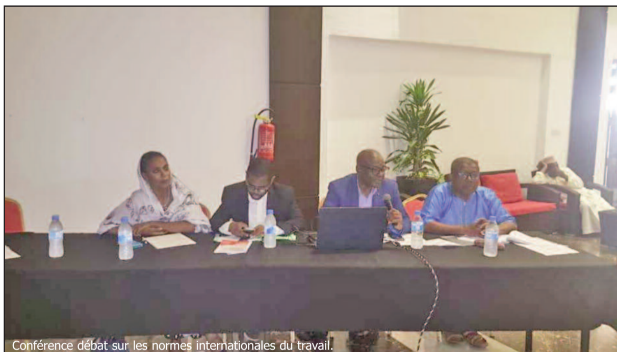
Conférence débat sur les normes internationales du travail.