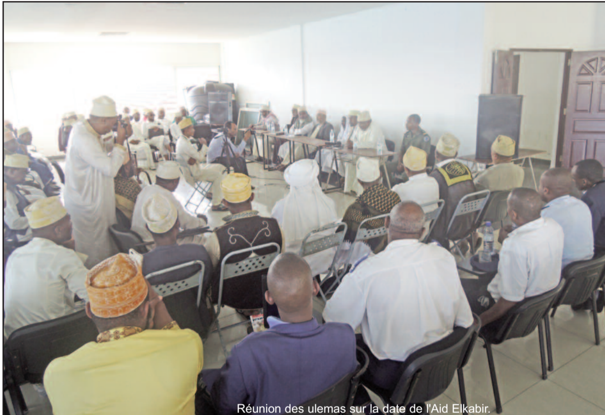
Réunion des ulemas sur la date de l'Aid Elkabir.